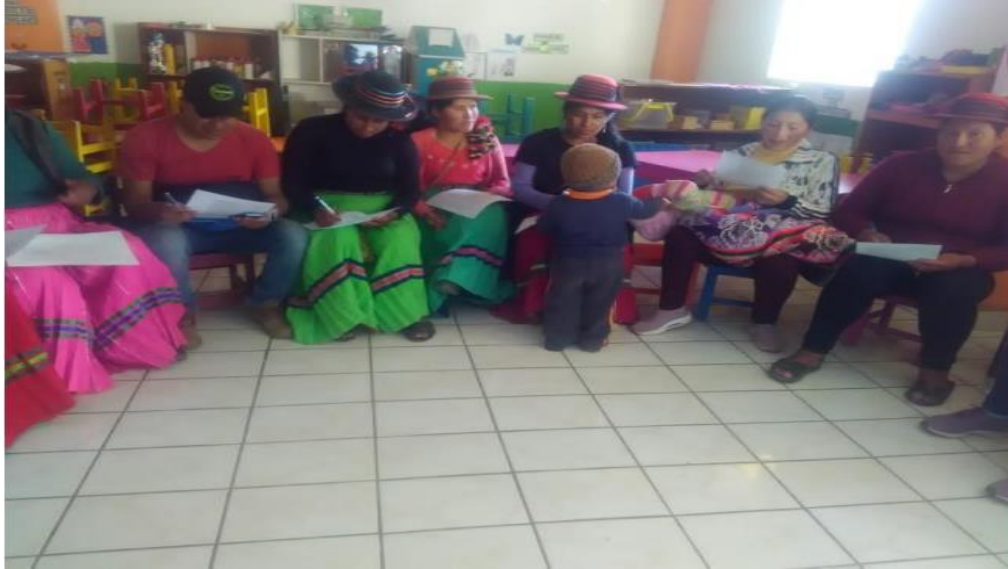
Padres participando de la reunión.