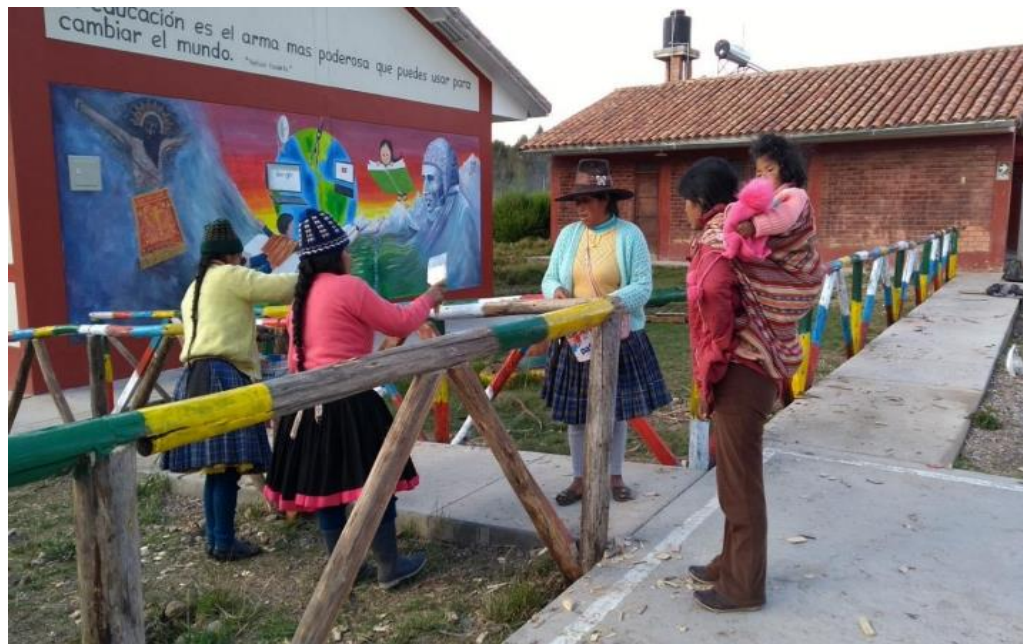
Padres participando en las jornadas de la Institución Educativa.