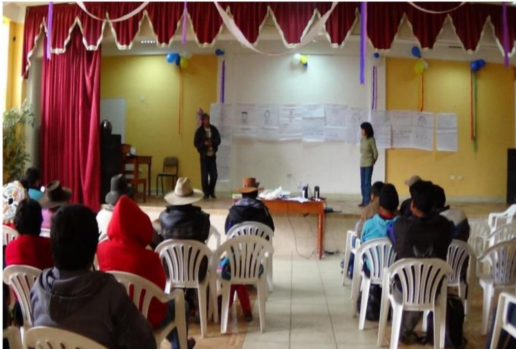
Padres participando en la asamblea de la Institución Educativa.