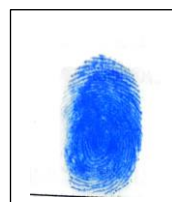
Elsa Cachique Amasifuen