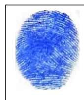
China Rice Cachique Shupingahua