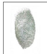
Milagros Sangama Ishuiza